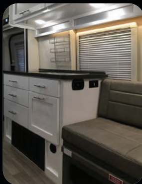
Armoires blanches à haute brillance

Ce versatile motorisé de classe B a été conçu pour le mode de vie actif d'aujourd'hui. Vous bénéficierez d'une économie d'essence sans précédent jumelée à la fiabilité et au style légendaire de Ford®. Relaxez dans des sièges capitaines luxueux tout en regardant le paysage à travers de très grandes fenêtres sans cadre apparent. L'ergonomie à l'intérieur vous assure d'être aussi confortable sur la route qu'à la maison. Beyond vous amène là où l'action se trouve, et avec style!