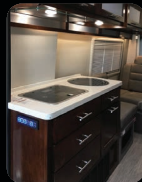
Armoires Cherry à haute brillance