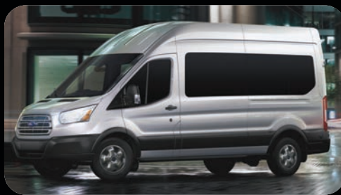
Peinture extérieure Ingot Silver maintenant disponible